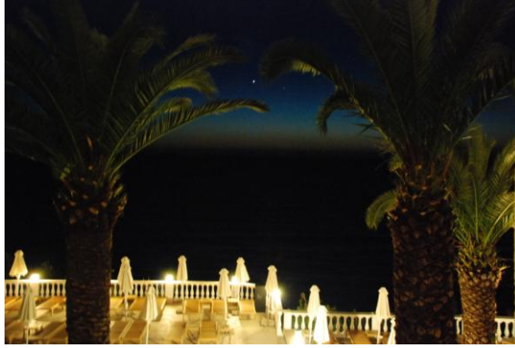
Φωτ.9 : Στο ξενοδοχείο Aquis Ag.Gordios Beach Hotel -Corfu(246 δωματίων, 4*-2008) το «μπαλκόνι» , μια βασική βεράντα ανάμεσα σε καλά φωτισμένους φοίνικες σποτελεί βασικό εστιακό σημείο και επιλογή του σχεδιασμού.

Η ποικιλία δραστηριοτήτων προβλέπεται ήδη από το σχεδιασμό: εκτός από ό,τι σχετίζεται με την πισίνα, την ξεκούραση και τις ρομαντικές στιγμές, η τουριστική βιομηχανία αναζητά να προσφέρει και άλλες δυνατότητες στους επισκέπτες. Τέτοιες είναι κάποιες «ειδικές δραστηριότητες» , όπως για παράδειγμα δραστηριότητες τύπου «περιπέτειας» , που μπορεί να περιλαμβάνουν εκδρομές με ποδήλατο στο βουνό, πεζοπορίες, αναρριχήσεις ή ακόμα και δυνατότητα ελεύθερης πτώσης. (βλ. Εικ.10) Για το λόγο αυτό προβλέπονται ειδικές κατασκευές που θα πρέπει να συμφωνούν με προδιαγραφές που συχνά παρέχει το τουριστικό πρακτορείο. Πρέπει εδώ να τονιστεί ότι συνήθως τέτοιες δυνατότητες δεν περιλαμβάνονται στις οικονομικές συμφωνίες τύπου “all inclusive” (που περιλαμβάνουν υπηρεσίες διαμονής και διατροφής), και άρα αποτελούν πρόσθετους οικονομικούς πόρους για τις τουριστικές επιχειρήσεις. Είναι λοιπόν βασικό στοιχείο του σχεδιασμού και της γενικής διάταξης του χώρου να «φαίνονται» αυτές οι εγκαταστάσεις όταν υπάρχουν, να τονίζονται, να τραβούν την προσοχή και να προσελκύουν τους επισκέπτες.