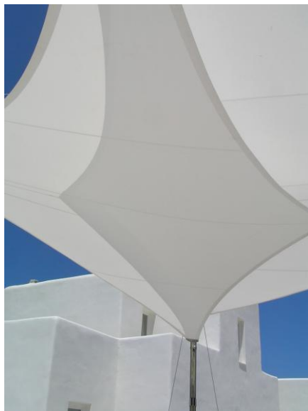
Φωτ.6-7: Ο συνδυασμός των εφελκόμενων στεγάστρων στην είσοδο του ξενοδοχείου Archipelagos Resort Hotel & Villas (5*)στην Πάρο.

λευκό στέγαστρο τονίζοντας το πέρασμα από το ένα ύψος στο άλλο και διαμορφώνοντας έτσι έναν ιδιαίτερο χαρακτήρα.