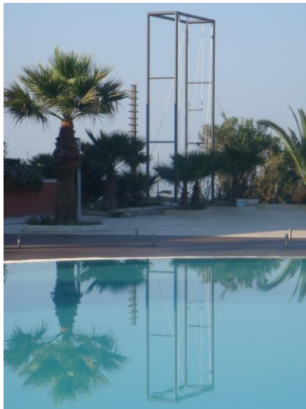
Φωτ.10 : Ειδική μεταλλική κατασκευή για ελεγχόμενη ελεύθερη πτώση στο ξενοδοχείο Aquis Sandy Beach Resort -Corfu (566 δωματίων-2009) Η χωροθέτηση έγινε με τέτοιο τρόπο ώστε να είναι ορατή η οποιαδήποτε δραστηριότητα από την κεντρική πισίνα, να δημιουργεί περιέργεια και να ωθεί τους επισκέπτες στην παροχή των υπηρεσιών που χρεώνονται επιπλέον.

Η ποικιλία δραστηριοτήτων προβλέπεται ήδη από το σχεδιασμό: εκτός από ό,τι σχετίζεται με την πισίνα, την ξεκούραση και τις ρομαντικές στιγμές, η τουριστική βιομηχανία αναζητά να προσφέρει και άλλες δυνατότητες στους επισκέπτες. Τέτοιες είναι κάποιες «ειδικές δραστηριότητες» , όπως για παράδειγμα δραστηριότητες τύπου «περιπέτειας» , που μπορεί να περιλαμβάνουν εκδρομές με ποδήλατο στο βουνό, πεζοπορίες, αναρριχήσεις ή ακόμα και δυνατότητα ελεύθερης πτώσης. (βλ. Εικ.10) Για το λόγο αυτό προβλέπονται ειδικές κατασκευές που θα πρέπει να συμφωνούν με προδιαγραφές που συχνά παρέχει το τουριστικό πρακτορείο. Πρέπει εδώ να τονιστεί ότι συνήθως τέτοιες δυνατότητες δεν περιλαμβάνονται στις οικονομικές συμφωνίες τύπου “all inclusive” (που περιλαμβάνουν υπηρεσίες διαμονής και διατροφής), και άρα αποτελούν πρόσθετους οικονομικούς πόρους για τις τουριστικές επιχειρήσεις. Είναι λοιπόν βασικό στοιχείο του σχεδιασμού και της γενικής διάταξης του χώρου να «φαίνονται» αυτές οι εγκαταστάσεις όταν υπάρχουν, να τονίζονται, να τραβούν την προσοχή και να προσελκύουν τους επισκέπτες.