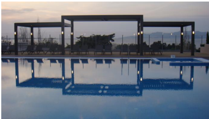
Φωτ.3 (Άποψη από το ίδιο ξενοδοχείο). Η ποικιλία των αντανάκλασεων δημιουργεί μια πλούσια εικονογραφία. Αυτό επιδιώκεται ήδη από τον αρχικό σχεδιασμό.

Η εικονογραφία που συνδέεται με το σχεδιασμό εμπλουτίζεται από τις αντανάκλασεις που προσφέρουν τα στοιχεία του χώρου στην υδάτινη επιφάνεια. Τα σχήματα διπλασιάζονται και προκύπτει η αίσθηση ότι «ολοκληρώνονται» αισθητικά. Για το λόγο αυτό, ο σχεδιασμός δεν παραμένει στο «άμεσα ορατό», αλλά επεκτείνεται στο «έμμεσα ορατό», ένα αισθητικό δηλαδή αποτέλεσμα που μπορεί να καταστήσει το χώρο ακόμα πιο ελκυστικό. Ειδικά σε περίπτωση εκδηλώσεων, τα είδωλα και οι αντανάκλασεις πολλαπλασιάζουν την αίσθηση του χώρου και δημιουργούν ένα πρόσθετο κλίμα άνεσης και απόλαυσης.