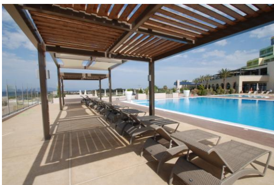
Φωτ.4 (Άποψη από το ίδιο ξενοδοχείο). Ο μεταλλικός σκελετός προσδίδει μεγαλύτερη ευελιξία , χαμηλότερο κόστος συντήρησης σε σχέση με το ξύλο και δίνει τη δυνατότητα σε πολλαπλές διαμορφώσεις με εφελκόμενα στοιχεία από ειδικά τεντόπανα με μικροδιάτρηση.

Δεδομένου ότι το μεγαλύτερο μέρος του χρόνου παραμονής τους οι επισκέπτες το αναλώνουν στον υπαίθριο χώρο, ο σχεδιασμός δίνει μεγάλη προσοχή σε χώρους ηλιασμού και σκίασης προκειμένου να διατηρηθεί μια ομαλή ισορροπία παρέχοντας προστασία χωρίς όμως να χαθεί η επαφή με τη θέα ή τις διαδορετικές δραστηριότητες. Εδώ, μέρος του υπαίθριου χώρου παρέμεινε χωρίς στέγαστρα (δόθηκε η δυνατότητα σε ομπρέλλες με το σκεπτικό της ευελιξίας στη σκίαση), ενώ ένα άλλο μέρος φιλοξένησε στέγαστρα σε δύο επίπεδα προκειμένου για τον μη-εγκλωβισμό της φυσικής θερμότητας .