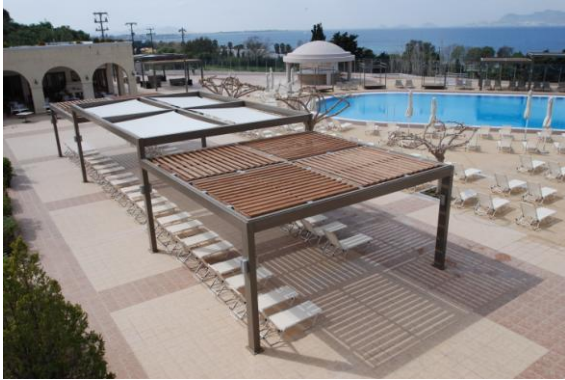
Φωτ.2 : Γενική άποψη του χώρου της πισίνας στο Kipriotis Panorama Hotel & Suites, Kos.

Η εικονογραφία που συνδέεται με το σχεδιασμό εμπλουτίζεται από τις αντανάκλασεις που προσφέρουν τα στοιχεία του χώρου στην υδάτινη επιφάνεια. Τα σχήματα διπλασιάζονται και προκύπτει η αίσθηση ότι «ολοκληρώνονται» αισθητικά. Για το λόγο αυτό, ο σχεδιασμός δεν παραμένει στο «άμεσα ορατό», αλλά επεκτείνεται στο «έμμεσα ορατό», ένα αισθητικό δηλαδή αποτέλεσμα που μπορεί να καταστήσει το χώρο ακόμα πιο ελκυστικό. Ειδικά σε περίπτωση εκδηλώσεων, τα είδωλα και οι αντανάκλασεις πολλαπλασιάζουν την αίσθηση του χώρου και δημιουργούν ένα πρόσθετο κλίμα άνεσης και απόλαυσης.