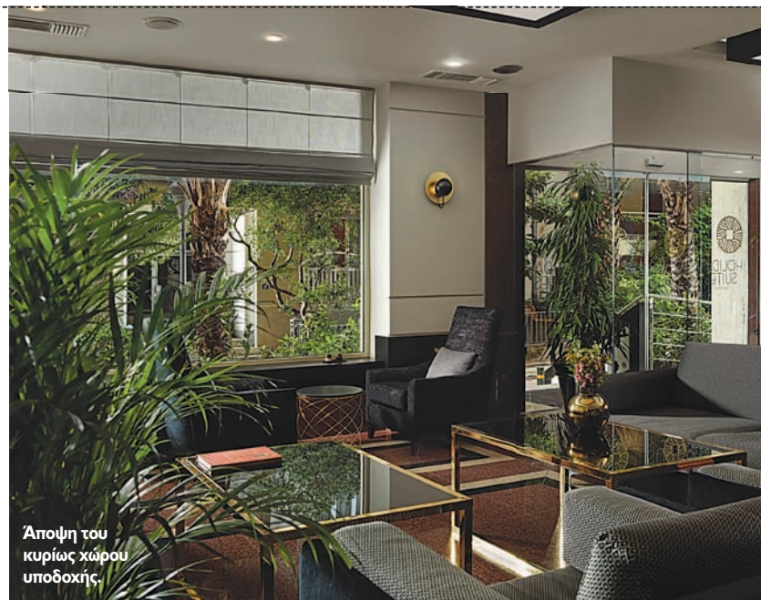
Άποψη του κυρίως χώρου υποδοχής.