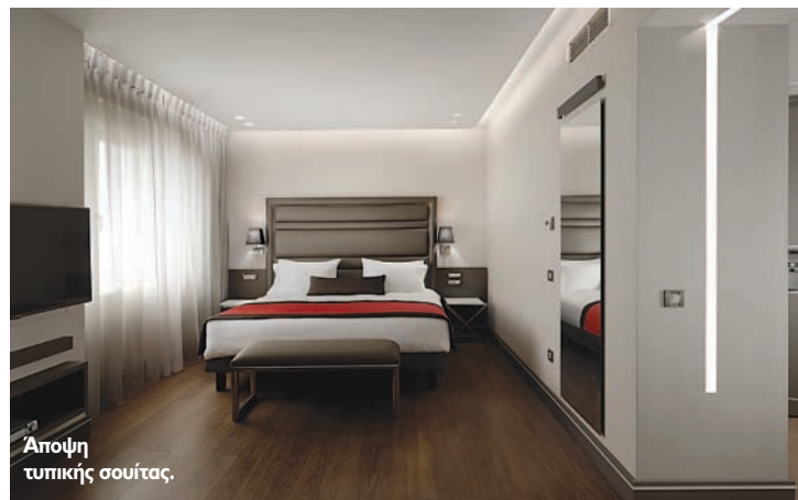
Άποψη τυπικής σουίτας.