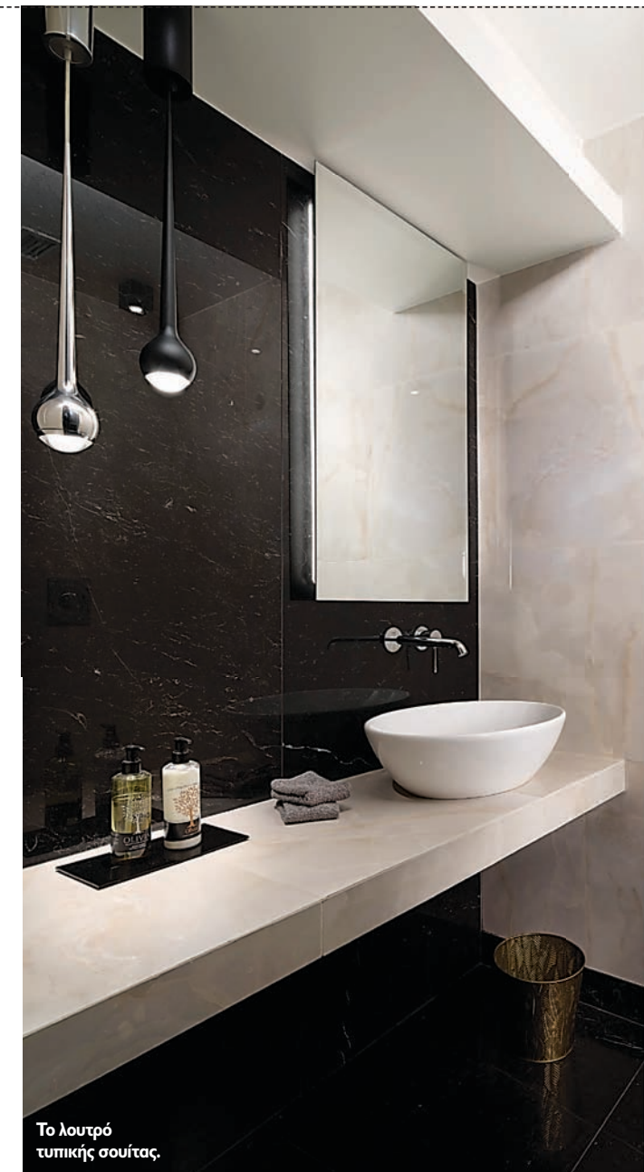
Το λουτρό τυπικής σουίτας.

ΑΡΧΙΤΕΚΤΟΝΙΚΗ ΜΕΛΕΤΗ: Χάρης Παπαϊωάννου & Συνεργάτες ΜΕΛΕΤΗ ΕΣΩΤΕΡΙΚΩΝ ΧΩΡΩΝ: Χάρης Παπαϊωάννου, Αφροδίτη Τσουκαλά ΕΠΙΒΛΕΨΗ: Χάρης Παπαϊωάννου, Αφροδίτη Τσουκαλά ΣΥΝΕΡΓΑΤΗΣ: Κωνσταντίνος Κοντογιάννης ΓΙΠΕΥΘΥΝΟΣ ΜΗΧΑΝΙΚΟΣ ΕΡΓΟΥ: Γιάννης Κεσκινόγλου ΤΟΠΟΘΕΣΙΑ: Οδός Άρνης 4, Ιλίσσια, Αθήνα ΣΥΝΟΛΙΚΟ ΕΜΒΑΔΟ ΚΤΙΡΙΟΥ: 1.500,00 μ 2 ΧΡΟΝΟΣ ΜΕΛΕΤΗΣ: 2016 ΧΡΟΝΟΣ ΚΑΤΑΣΚΕΥΗΣ: 2017 ΠΑΡΟΥΣΙΑΣΗ ΚΤΙΡΙΟΥ: Χάρης Παπαϊωάννου