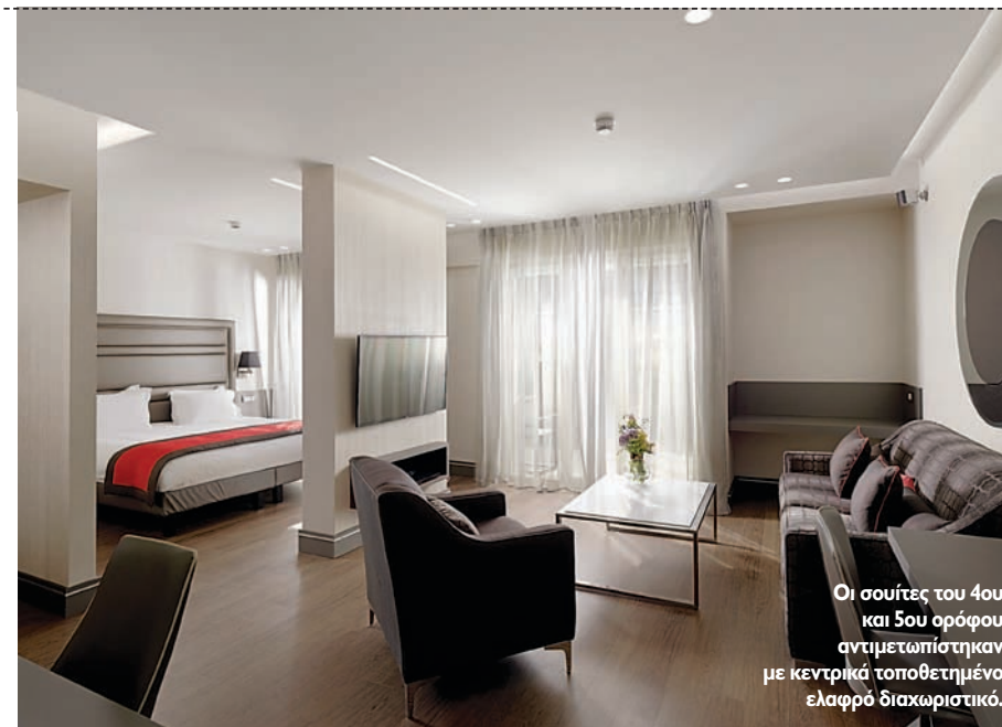
Οι σουίτες του 4ου και 5ου ορόφου αντιμετωπίστηκαν με κεντρικά τοποθετημένο ελαφρύ διαχωριστικό.