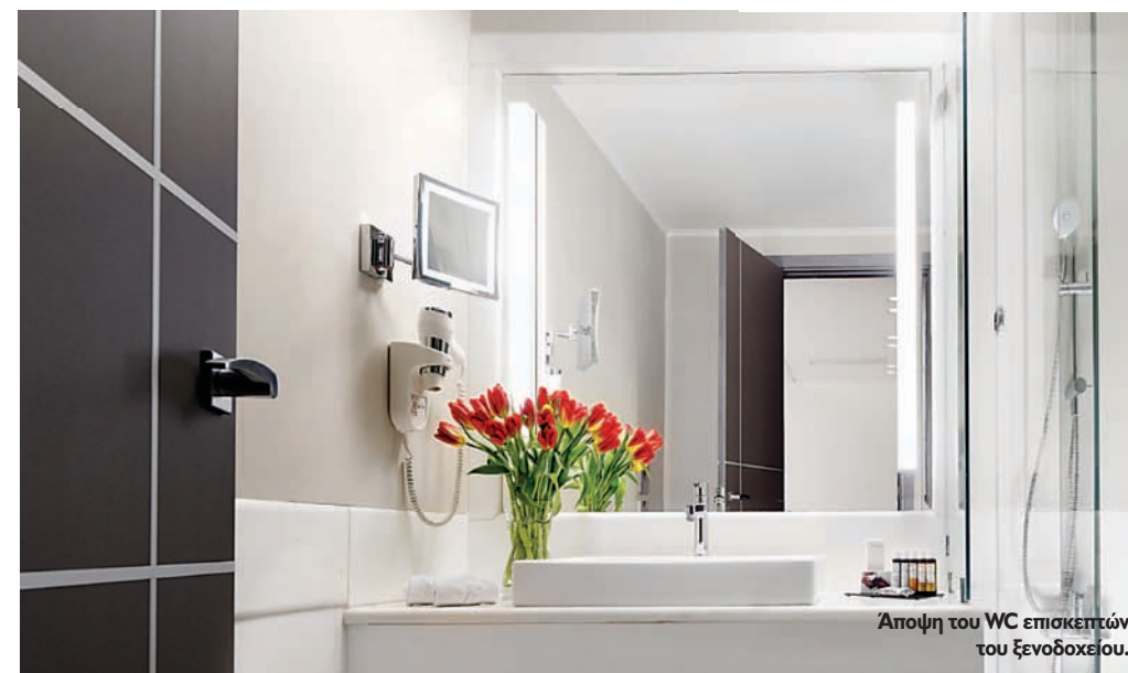
Άποψη του WC επισκεπτών του ξενοδοχείου.