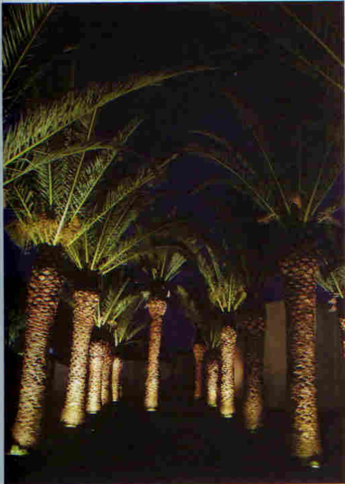
ΑΠΟΨΗ ΤΗΣ ΑΝΑΔΕΙΞΗΣ ΤΗΣ ΣΥΣΤΑΔΑΣ ΦΟΙΝΙΚΩΝ ΣΤΟΝ ΚΗΠΟ