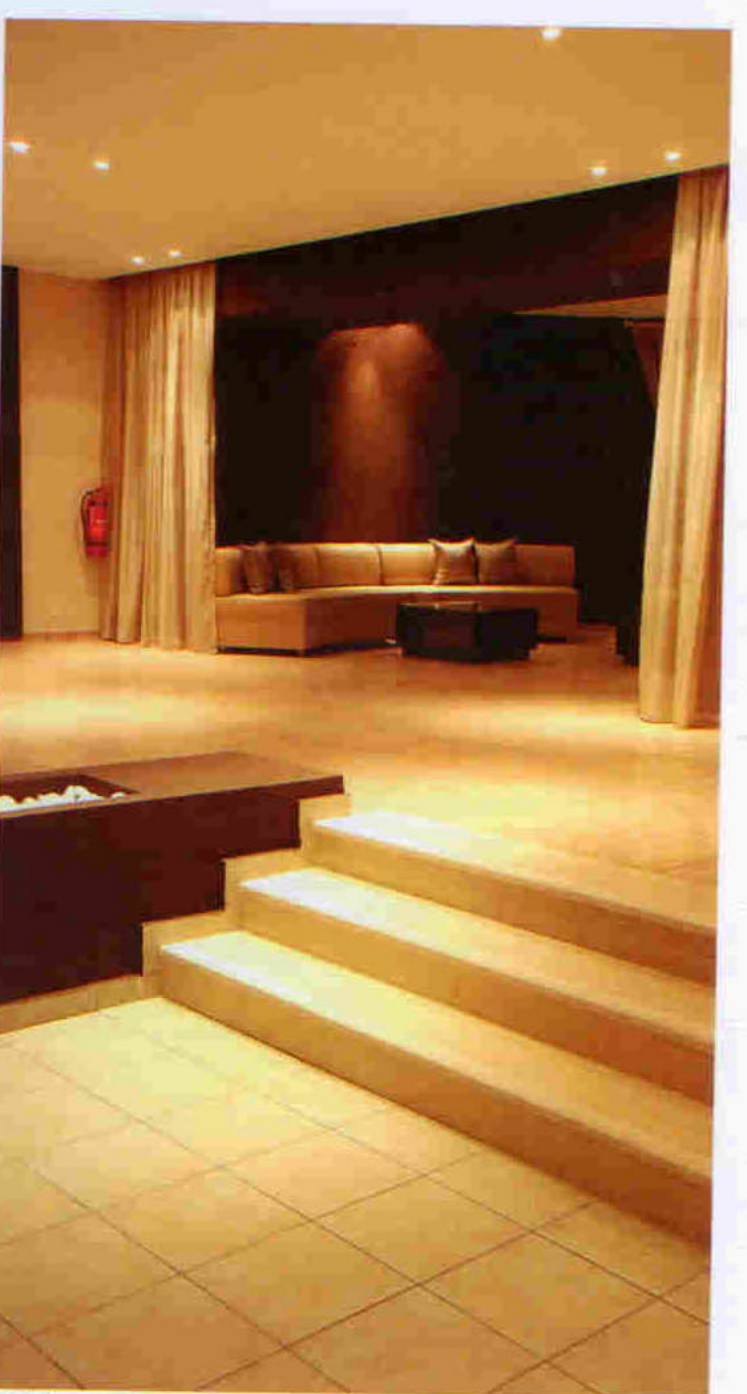
ΑΠΟΨΗ ΑΡΟ ΤΟ ΒΑΡ