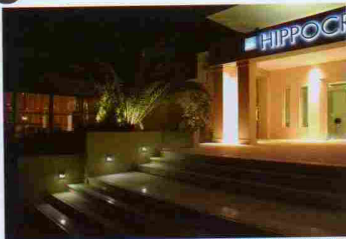
ΒΡΑΔΙΝΗ &amp; ΠΡΩΙΝΗ ΑΠΟΨΗ ΤΗΣ ΕΙΣΟΔΟΥ ΜΕΤΑ ΤΗΝ ΑΝΑΔΙΑΜΟΡΦΩΣΗ