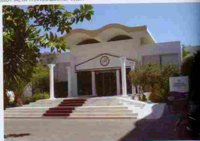
ΑΠΟΨΗ ΤΗΣ ΕΙΣΟΔΟΥ ΠΡΙΝ ΤΗΝ ΑΝΑΔΙΑΜΟΡΦΩΣΗ

Το Ξενοδοχείο Kipriotis Hippocrates Hotel είναι ένα ξενοδοχείο 4* δυναμικότητας 168 δωματίων στη θέση Ψαλίδι της Κω. Απέχει 4 κλμ από την πόλη και βρίσκεται σε ήρεμο περιβάλλον με πολύ καλή θέα στη θάλασσα και με ευρύχωρο κήπο. Διαθέτει χώρους άθλησης και αναψυχής όπως γήπεδο τένις, beach volley, κλειστό γυμναστήριο, εσωτερική και εξωτερική πισίνα.