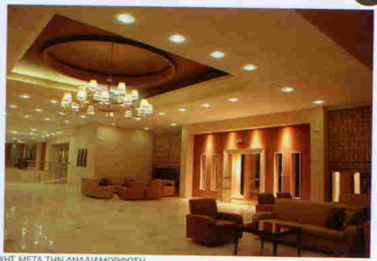
ΓΕΝΙΚΗ ΑΠΟΨΗ ΤΟΥ ΧΟΡΟΥ ΥΠΟΔΟΧΗΣ ΜΕΤΑ ΤΗΝ ΑΝΑΔΙΑΜΟΡΦΩΣΗ