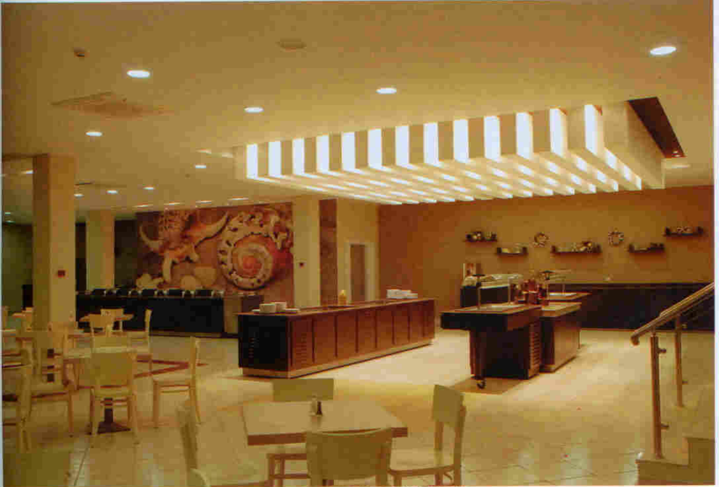
ΑΠΟΨΗ ΤΟΥ ΕΣΤΙΑΤΟΡΕΙΟΥ ΜΕΤΑ ΤΗΝ ΑΝΑΔΙΑΜΟΡΦΩΣΗ